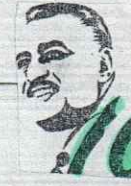
جمال عبدالناصر ١٩١٨-٢٠١٨