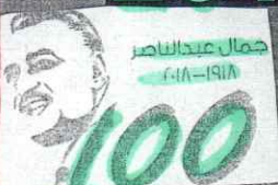
جمال عبدالناصر ١٩١٨-٢٠١٨