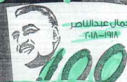
جمال عبدالناصر ١٩١٨-٢٠١٨